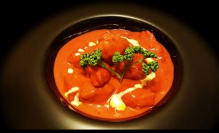
Poulet tikka masala