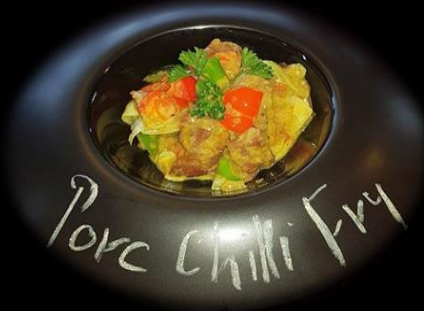
Porc Chilli Fry